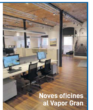
Noves oficines al Vapor Gran