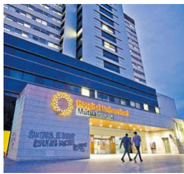
Hospital Mútua Terrassa.

L'activitat productiva de les empreses catalanes s'ha desplomat un 66% a conseqüència de la crisi sanitària del coronavirus, que va portar el Govern a decretar l'estat d'alarma, segons una enquesta elaborada per la patronal local Cecot. L'estudi, fet a un total de 507 empreses catalanes, posa de manifest que la falta de comandes (33% de les respostes) és la primera raó al·legada per explicar la caiguda de l'activitat. El segon factor és la "incertesa en l'aplicació de l'estat d'alarma" i també la manca de mobilitat. PÀGINES 2 I 3