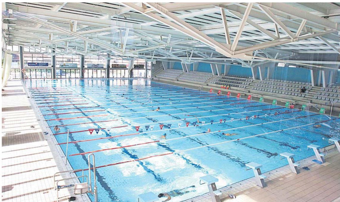
Les instal·lacions del CN Terrassa, com les de la resta d'entitats, resten tancades des de fa uns dies.

L'ERTO, no concedit encara, afecta el 100% de la plantilla de l'entitat, "amb un impacte diferent segons la funció que porta a terme