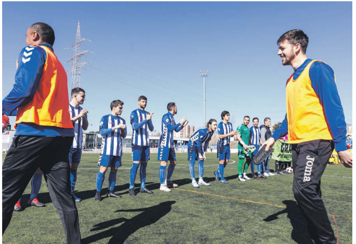
Los jugadores del San Cristóbal quieren mantener su fortaleza como locales. LLUÍS CLOTET

El San Cristóbal, con la baja de Almirall, llega a este compromiso después de dos salidas consecuti-