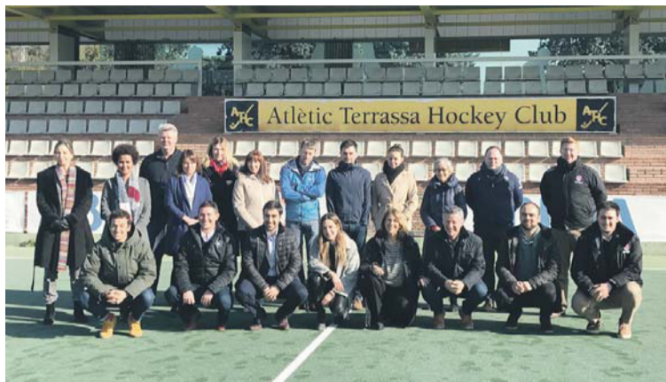
Los participantes en estas jornadas, en el campo Josep Marquès.

La primera reunión del "Stick Project", una iniciativa que quiere implementar un esquema de movilidad europea para que los deportistas puedan estudiar por toda Europa, se desarrolló esta semana, entre el jueves y el viernes, en las instalaciones del Atlètic Terrassa Hockey Club y en la Universitat Autònoma de Barcelona. Con esta primera toma de contacto se ha puesto en marcha la iniciativa Erasmus + / Sport Stick. Se trata de un consorcio formado por cinco clubs europeos, entre los que figura el Atlètic, promotor del proyecto. Los otros cuatro son el Beeston inglés, el Dragons belga, el Rotterdam holandés y el Pembroke irlandés. Cada uno de los cinco clubs tiene una universidad vinculada, de manera que los jugadores de esos clubs podrán obtener todo tipo de facilidades para estudiar en cualquiera de esos centros.